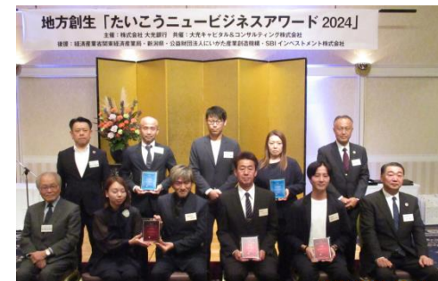
【たいこうニュービジネスアワードの様子】