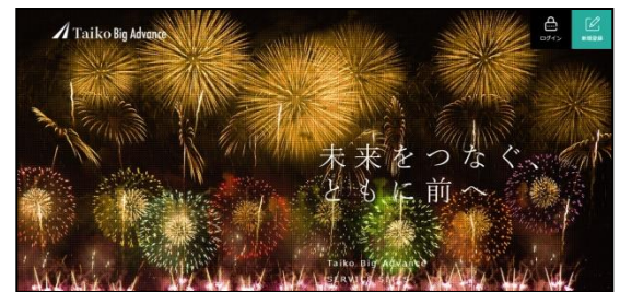
【Taiko Big Advance ログイン画面】